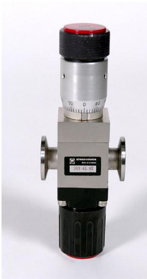
نمونه خارجی شیرسوزنی خلاء

خلاء سوزنی با قابلیت افزایش میزان دبی عبوری نسبت به شیرهای متداول و بررسی مبانی تئوریک شیرهای سوزنی می باشد. با بررسی دقیق قطعات از نظر جنس متریال، ابعاد و اندازه، تolerانس ها و پیچیدگی و تعداد (فقط یک نمونه)، روش و تکنولوژی مورد نیاز و مناسب جهت ساخت قطعات مشخص گردید و تمامی قطعات مورد ساخت قرار گرفت. قطعات استاندارد مانند پیچها، خارها و ... جزو قطعات خریدنی محسوب شده و از بازار تهیه شدند. در این مرحله تمامی قطعات از نظر کنترل کیفی و طبق طرح کنترل های تهیه شده، قطعات بررسی و پس از تأیید، مطابق با دستور العمل مونتاژ تدوین شده در این پروژه، محصول مونتاژ شده و تستهای عملکردی طبق دستورالعمل انجام و نتایج ثبت گردید. در پایان نتایج تست شیر اصلی (نمونه خارجی محصول) با شیر ساخته شده در این پروژه مقایسه گردید و نتایج نشان داد که شیر تولید شده مورد تأیید بوده و از کیفیت خوبی برخوردار است.